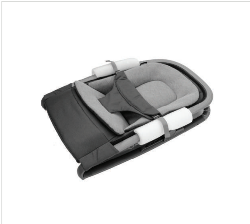
Maxi-Cosi | Kori 0 M / Max 9 kg | 3